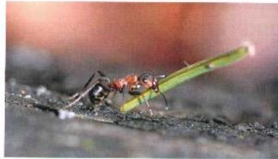
Arbeiterin beim Transport von Nestbaumaterial

Ameisenzeit ist ein 10-jähriges Projekt von WaldBiederBasel und dem Basellandschaftlichen Natur- und Umweltschutzverband. Es umfasst die beiden Bieder Halbkantone sowie einige angrenzende solothurnische und aargauische Gemeinden. Das Projekt setzt sich gemeinsam mit rund 45 freiwilligen Ameisengöttern und Ameisengöttern sowie zahlreichen Forstleuten für den Schutz der Waldameisen ein. Die Waldameisen übernehmen wichtige Funktionen im Naturhaushalt unserer Wälder. Sie verbreiten die Samen von rund 150 Pflanzenarten, fördern Insekten die Honigtau produzieren und können bei Schädlingsmassenregulierung eingreifen. Leider ist die Waldameise in gewissen Teilen der Schweiz bedroht und steht auf der Roten Liste.