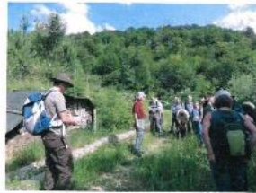
Ameisenexkursion in Lausen 2018

Von den rund 140 in der Schweiz vorkommenden Ameisenarten zählen sechs Arten zu der Gruppe der Waldameisen. In der Region Basel wurden bis anhin fünf der in der Schweiz heimischen Waldameisenarten nachgewiesen. Die sechste Art kommt bis heute nur im Kanton Graubünden vor. Mit ihrer sozialen Struktur, ihren unglaublichen Nestbauten und ihrer grossen Anzahl an Individuen vermögen die Waldameisen die meisten Wald- und Naturliebhaber zu faszinieren. Sie. Ameisenzeit lerren Sie diese spannenden Tiere kennen und erhalten Zugang zu einem Netzwerk, welches den Austausch zwischen Ameiseninteressierten fördert und regelmässig Veranstaltungen zum Thema Ameisen anbietet.