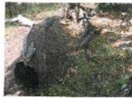
Ameisenest in Langenbruck

Kontakt: sabelle.guarzmann@nateco.ch / 061 985 44 40 oder www.ameisenzeit.ch