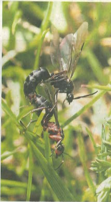
Gotten und Götti gesucht. Ein Projekt soll die Wichtigkeit von Waldameisen bekannt machen.

Die rund einen Zentimeter grossen Tiere verbreiten Pflanzensamen, stellen eine Nahrungsquelle für andere Tiere dar – namentlich für den Grünspecht, der sich zu mehr als 50 Prozent von Ameisen ernährt – und sorgen gleichzeitig dafür, dass Schadinsekten wie der Borkenkäfer nicht überhandnehmen. Zudem verbessern die Waldameisen die Durchlüftung des Bodens und sie fördern durch Schutz und Betreuung von Blattlauskolonien die Bildung von Honigtau: Dieser zuckerreiche Saft dient