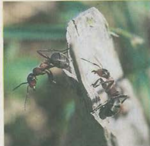
Waldameisen.