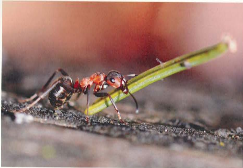
Unglaublich ist die Leistungsfähigkeit einer Ameise, die selbst grosse Lasten über weite Strecken transportiert.

Das Projekt des Waldwirtschaftsverbands und des BNV wird von Isabelle Glanzmann koordiniert. Weitere Informationen finden Sie unter www.ameisenzeit.ch